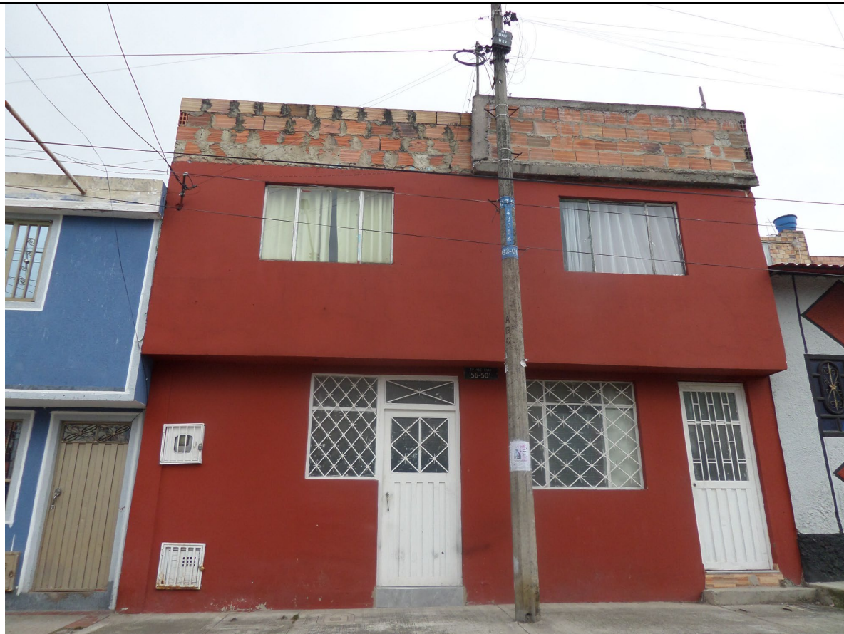
IMAGEN 3: PREDIO