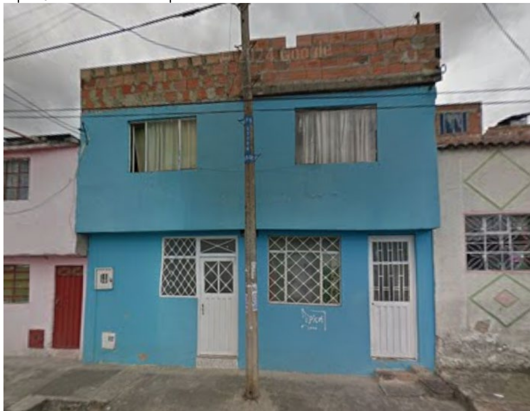
Vivienda de tres pisos

Vivienda de dos pisos.