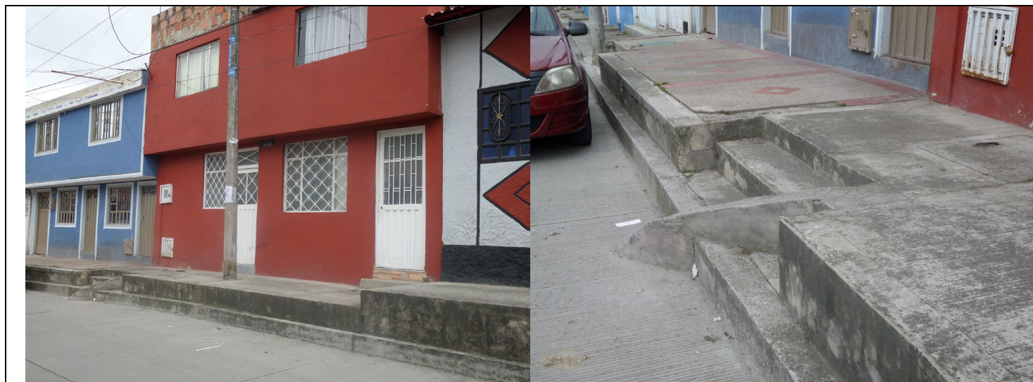
IMAGEN: FOTOGRAFIA GOOGLE MAPS 2012 AL 2021

Imagen Google Maps 2012. Vivienda de dos pisos.