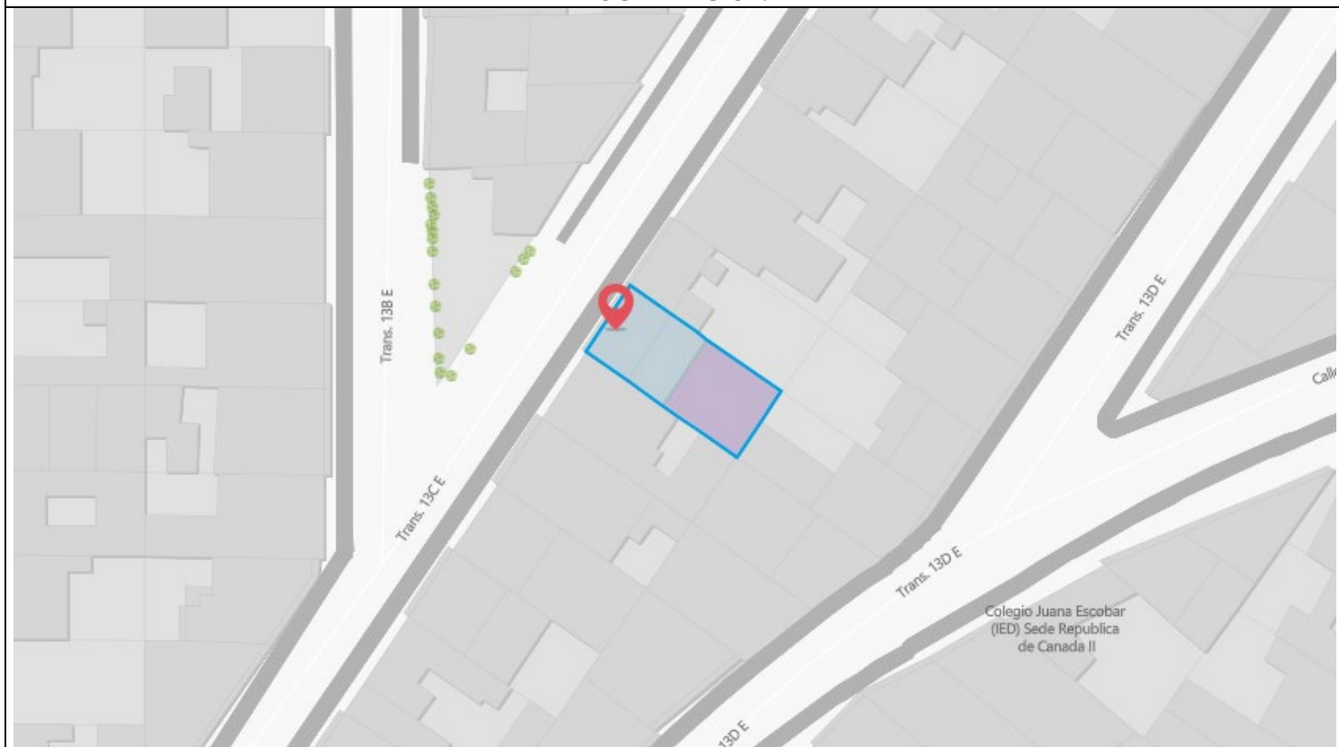
IMAGEN 1: NOMENCLATURA